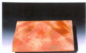
Chapeau pointe de diamant CPL..