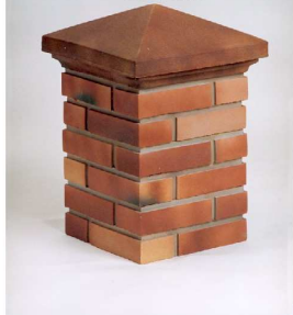
Chapeau pointe de diamant avec un bandeau CPLS..

Bandeau : pièce complémentaire s'emboîtant sous le chapeau