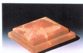
Chapeau pointe de diamant avec rebord CPLB ..

CPLS36 : 36*36 cm : 8,8 kg CPLS39 : 39*39 cm : 12,3 kg CPLS46 : 46*46 cm : 20,2 kg