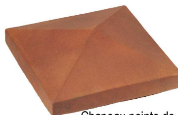
Chapeau pointe de diamant sans bandeau CPL..