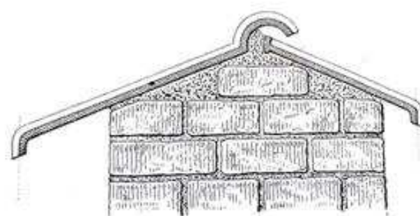
Montage à 2 pans dissymétriques